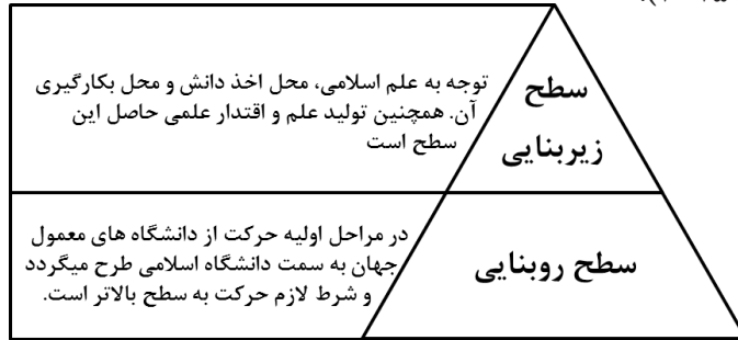
شکل شماره ۱- سطوح تحلیل اسلامی شدن دانشگاه (حسن، ۲۰۱۵)

خلاصه می‌توان گفت در دانشگاه اسلامی عالم علم را به عنوان وسیله‌ای برای تکامل روحی و طی درجات الهی و سیر و سلوک مورد استفاده قرار می‌دهد و علم در چنين دانشگاهی، صبغه الهی دارد نه رنگ مادی و استقلال آور است نه مرعوب پرور (دين و جانجوا، ۲۰۱۵).